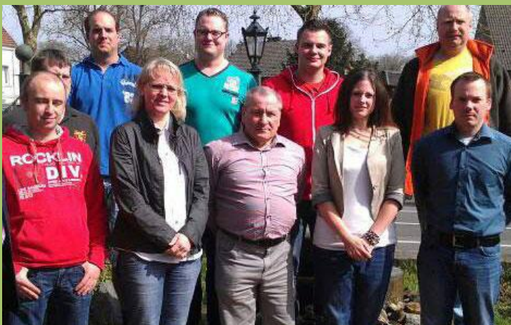
Der neue Vorstand der '53er Fanfaren

Wie in den letzten Jahren werden wir auf dem Gelände der KLJB Rhade einige gemütliche Stunden verbringen. Ebenfalls fester Bestandteil unseres Terminkalenders ist das 19. offizielle Treffen der „Interessengemeinschaft reiner Fanfarenzüge NRW“, welches in diesem Jahr in Dortmund-Wickede stattfinden wird. Zum zweiten Mal dabei sind wir beim Brezelfestumzug in Kirchhellen.