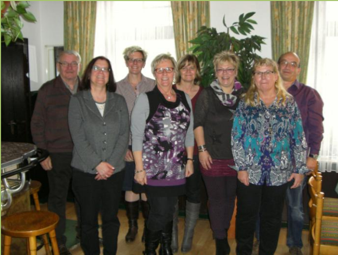
Der neue Vorstand des Schützenchore

Neue Sängerinnen und Sänger sind herzlich Willkommen!