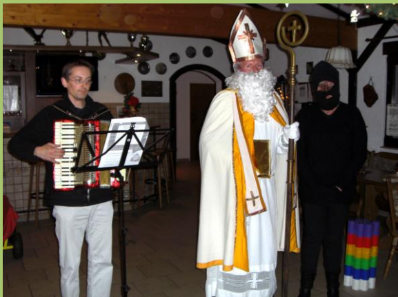
Hoher Besuch beim Schützenchor

Das absolute Highlight des Nachmittages war der Besuch des Heiligen Nikolaus und seines Gehilfen, Knecht Ruprecht persönlich. Alle Chormitglieder wurden von den beiden beschenkt.